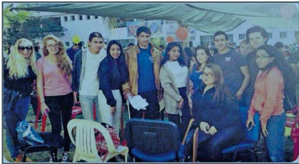
נושים שלום קטן. התכנית "חיים משותפים בנגב" מתמקדת בהכרות בין תלמידי בית הספר לבין תלמידי בתי הספר החרדיים.

שכבה י' נפגשת עם נוער בדואי, במסגרת התכנית "חיים משותפים בנגב" • "יש הרבה אפשרויות להגיע לשלום ולהשתלב עם מי שחיים איתנו בארץ", אומרת תלמידת י"ב/2