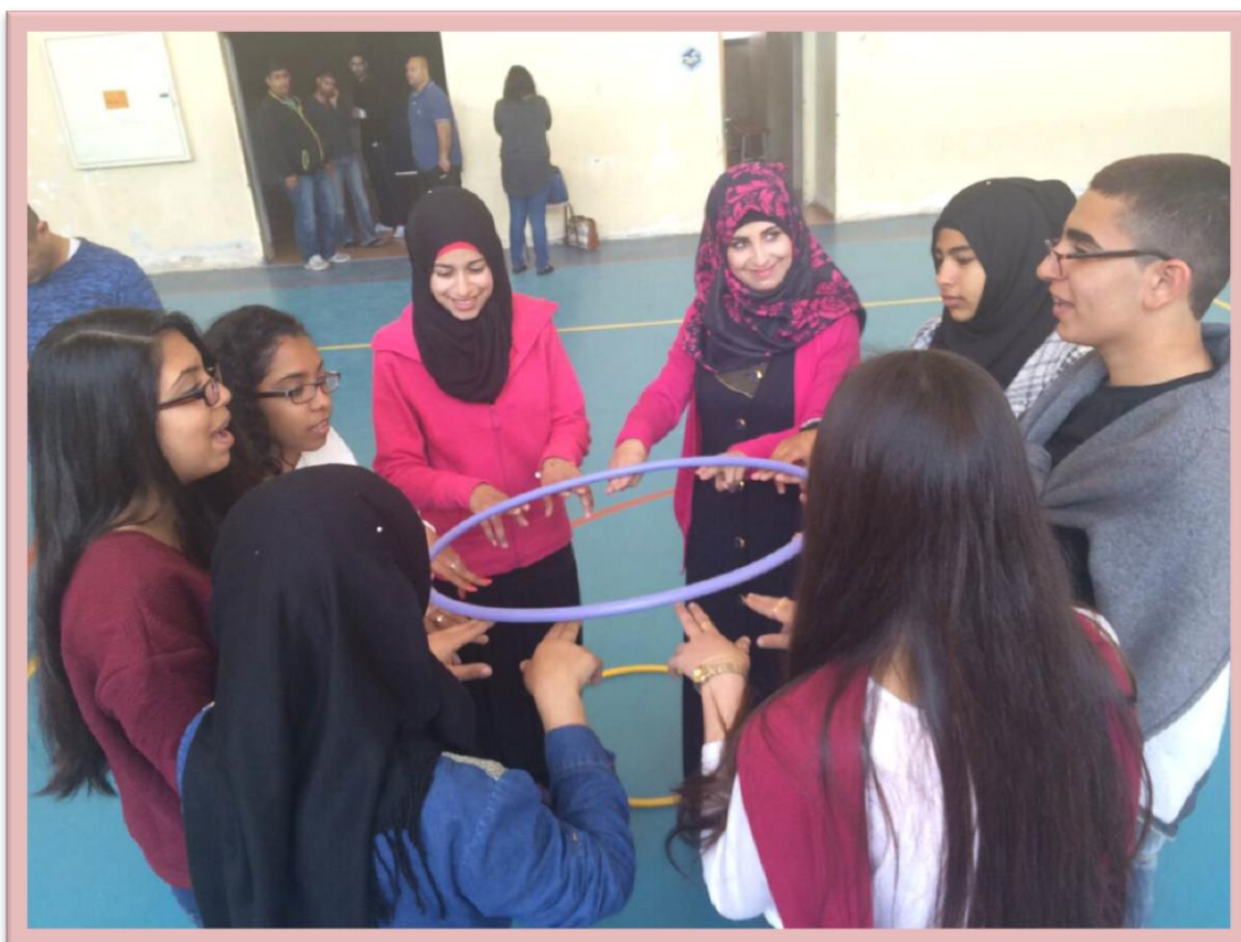
פעילות D.O.T בבקור בביה"ס אלפארוק בכסייפה