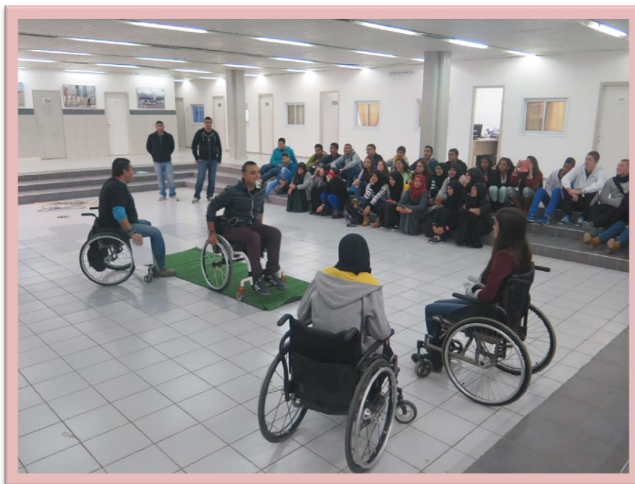
סדנא לקבלת האחר תוך המחשת מוגבלויות בביה"ס זינמן