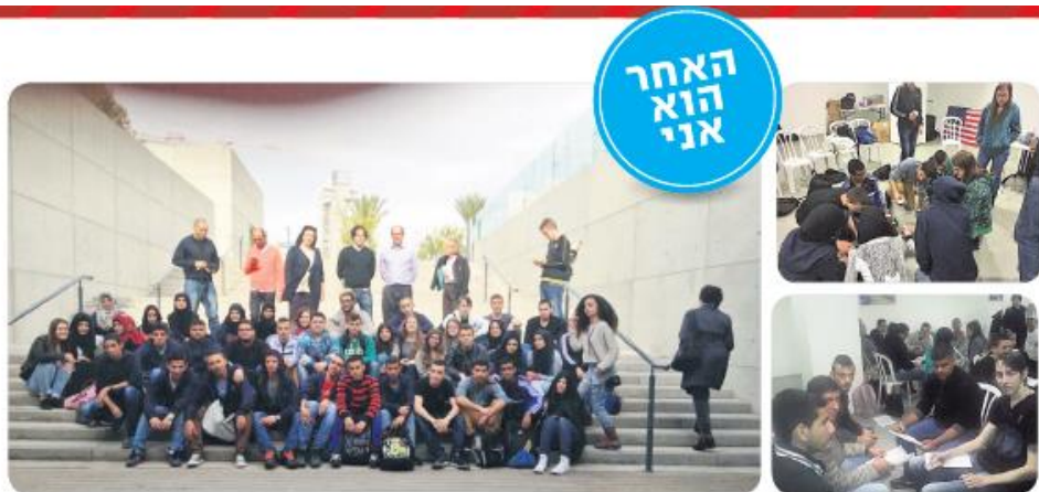
פעילות עם צעירי הכפר חורה. לתלמידים להכיר ולשתף פעולה